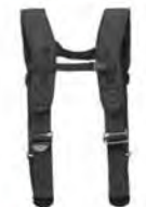
27. 型号 135R