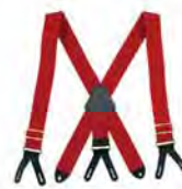
19. 型号 136RL