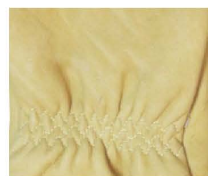
优质黄牛皮， 柔软、舒适