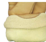
Kevlar内衬，提供进一步的 抗割、防火及隔热保护